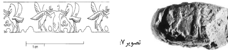
اسب بالدار روی گل مهر هخامنشی (Garrison & Cool Root, 2001, pl. 65, PFS 99)

(تصویر ۷). اسب در هنر هخامنشی از اهمیت ویژه‌ای برخوردار بوده است و در نقش برجسته‌ها، اشیای مفرغی، سفالی و یا ساخته شده از طلا و همچنین مهرها بسیار دیده می‌شود. تعدادی سکه در سده چهارم ق.م در غرب آسیای صغیر یافت شده که در پشت سکه تصویر اسب بالدار نقش بسته است. این سکه‌ها که از نوع نقره یا مفرغاند توسط ساتراپی‌های هخامنشی ضرب شده‌اند. به عنوان مثال از اسپیتريداتس (۴۰۰-۳۳۰ ق.م.) ساتراپ ایونیه و لیدیه سکه‌هایی بدست آمده که روی سکه تصویر سر وی و پشت سکه تصویر اسب بالدار نقر شده است (تصویر ۸).