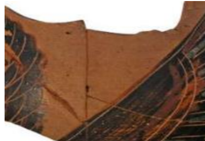
تصویر ۳: سمت راست، اسب بالدار، روی قطعه‌ای از سفال احتمالاً کوزه، ۵۳۰-۵۱۰ ق.م، شرق یونان، موزه بریتانیا (AN1896-1908-G.130.2)؛ سمت چپ، قطعه سفال، ۵۴۰-۵۳۰ ق.م، یونان، موزه بریتانیا (1888,0601.595)

( https://www.britishmuseum.org/collection/search?keyword )