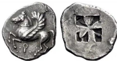
تصویر ۲: اسب بالدار در سکه استاتر یونانی، حدود ۵۶۰ ق.م - ( https://coinweek.com/pegasus-on-ancient-greek-coins/ )

آمده‌است آتنا به بلروفون افساری جادویی می‌دهد تا پگاسوس را هنگام نوشیدن آب از چشمه، اسیر کند. در حکایتی دیگر، بلروفون سوار بر پگاسوس با آمازونیان می‌جنگد و آنها را و هیولایی به نام کیمیری را شکست می‌دهد (موسوی کوهپیر و دیگران، ۱۳۹۲، ص. ۱۷۴). بلروفون سوار بر پگاسوس به سوی کوه المپ جایگاه خدایان می‌رود و زئوس را در پرتاب رعد و برق یاری می‌رساند. طبق اسطوره‌ای دیگر در یونان، پگاسوس وظیفه صاعقه را بر عهده داشته و بر اثر ضربه سم او بر کوه هلیکون، چشمه هیپوکرنه به وجود آمده‌است (رستگار فسایی، ۱۳۸۳، ص. ۴۵۳؛ Roman & Daly, 2009, P. 111). کهن‌ترین تصویر اسب بالدار با بال‌های حلقه‌ای بر روی سکه‌های یونانی مربوط به ۶۲۵-۵۸۵ ق.م. (تصویر ۲) و بر روی قطعه سفالی متعلق به ۵۱۰-۵۳۹ ق.م است (تصویر ۳). به طور کلی نقش اسب در یونان نشانه یکی از خدایان زیرزمینی بوده و به مفهوم مرگ نزدیک است. نقوش روی سفال یونانی بسیار شبیه نقوش سفال ایرانی است و احتمال آن می‌رود که یکی از الهام‌دهندگان هنر یونان از ربع سوم قرن ۸ ق.م، هنر ایران بوده باشد (گیرشمن، ۱۳۹۰ الف، صص. ۳۳۲-۳۳۳).