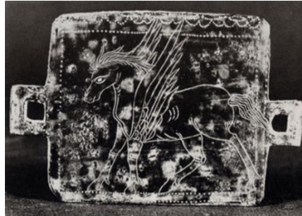
تصویر ۹: پلاک با نقش اسب بالدار، مسجد سلیمان (Ghirshman, 1976, II, pl. xcvi)

اسب بالدار به چشم می‌خورد (نیکنامی و دیگران، ۱۳۹۴، ص. ۱۵۱). به نظر می‌رسد نقوش اثر مهرهای سلوکی اوروک، به‌ویژه نقش اسب بالدار متأثر از هنر یونانی باشند. در بیشتر این نقوش، اسب بالدار در حالت پرواز حک شده است (تصویر ۱۰)