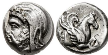
تصویر ۸: سکه اسپیتريداتس ساتراپ هخامنشی ایونیه و لیدیه

سلوکوس دوم در نیمه قرن دوم ق.م در ضرابخانه انطاکیه در سوریه سکه‌هایی ضرب کرد که پشت سکه تصویر پگاسوس رو به سمت چپ نقر شده بود. پس از کشف پلاک برنزی منقوش به تصویر اسب بالدار (تصویر ۹)، از دوره سلوکی در معبد بزرگ مسجد سلیمان، که شاید قسمتی از قلاف یک شمشیر بوده است، گیرشمن نتیجه گرفت که این حیوان اسطوره‌ای با معبد آتنا مرتبط بوده است (Magub, 2018, P. 219; Ghirshman, 1976, P. 88). در دوران هلنی، هم‌دوره با پلاک مذکور، تصویر اسب بالدار یک موضوع تزئینی برای اسلحه‌ها به شمار می‌آمده و حتی بر روی کلاه خود آتنا نیز نقش بسته است (Ghirshman, 1976, P. 88). از دوران سلوکیان در محوطه باستانی اوروک در ناحیه میانرودان چندین اثر مهر بر روی الواحی به خط میخی بابلی متأخر وجود دارد که روی بعضی از آنها تصویر