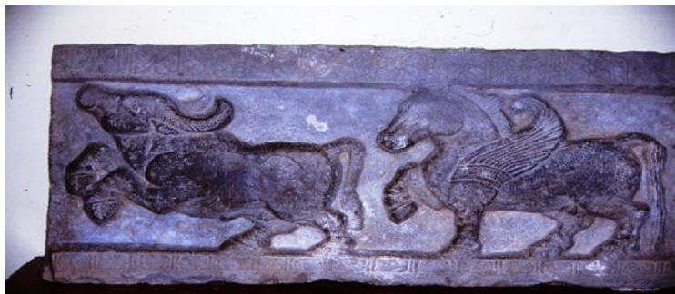
تصویر ۱: اسب بالدار بر روی سنگ نگاره، ایالت کرنا‌تکه هند (Fekripour, 2016, P. 588)

است و در ادبیات متأخر او را با پرنده‌ای به نام «گرودا» یکی دانسته‌اند. توصیف اسب اساطیری «پئیدوه» ۱ در ودا به صورت اسبی سفید رنگ و شایسته ستایش است که به آسمان‌ها دست می‌یابد. همچنین در ادبیات هندی درباره کشیدن گردونه خدایان توسط اسب‌های بالدار نیز داستان‌هایی ذکر شده است (قلی‌زاده، ۱۳۹۲، صص. ۵۰-۵۴). تصویر اسب بالدار بر روی سنگ نگاره‌های هند قابل مشاهده است (تصویر ۱).