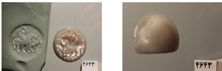
تصویر ۱۵: اسب بالدار دورهٔ ساسانی، موزهٔ بوعلی همدان

به هر حال با توجه به ناخوانا بودن کتیبه در زیر پای اسب خوانش‌های فوق تنها در حد حدس باقی می‌ماند.