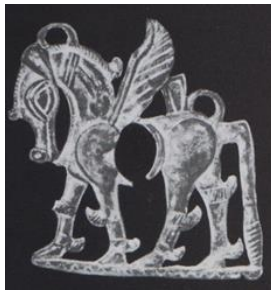
تصویر ۶: لگام مفرغی لرستان، قرن ۸ تا ۷ ق.م (گیرشمن، ۱۳۹۰ الف، ص. ۳۷۵)

تصویر ۵: سفال بدست آمده از سیلک با تزیین اسب بالدار و سوارکار، قرن ۱۰ تا ۹ ق.م (گیرشمن، ۱۳۹۰ الف، ۲۰۵). به طور کلی اسب گاهی نماد خورشید بود و گردونه آن را می‌کشید و گاهی نماد مرگ به شمار می‌رفت و روان متوفی را حمل می‌کرد. گیرشمن معتقد است که در دوره باستان اسب به منظور حمل روح مرده به دنیای دیگر همراه با متوفی دفن می‌شده است. مطالعات بر نقوش به دست آمده از این تپه نشان می‌دهد که تصویر اسب بالدار روی سفال نیز برای نشان دادن مرکبی برای حمل ارواح درگذشتگان بوده است (گیرشمن، ۱۳۹۰ الف، ص. ۱۴). نقش اسب بالدار به صورت فلکی فرس اعظم (اسب بالدار) نیز بازنمایی شده است (اکرم، ۱۳۸۷، ص. ۹۸۳). در لرستان سر سنجاق و لگام‌های مفرغی پیدا شده است که در میان آنها نقش اسب بالدار نیز به چشم می‌خورد (تصویر ۶) این لگام‌ها که در گورها و در زیر سر مردگان پیدا شده‌اند، به قرن ۸ تا ۷ ق.م مربوط می‌شوند (گیرشمن، ۱۳۹۰ الف، ص. ۶۱).