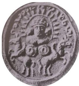
تصویر ۱۳: مهر ساسانی، نقش ایزد مهر و اسبان بالدار (گیرشمن، ۱۳۹۰، ص. ۲۴۳)

تصویر اسب بالدار در کنار نقوش مرتبط با ایزدان ساسانی از جمله مهر و آتش نیز آمده است که از آن جمله می‌توان به مَه‌ری با نقش ایزد مهر و اسبان بالدار که وظیفه حمل او را بر عهده دارند، اشاره کرد (تصویر ۱۳). نقوش این مهر، توصیف مهر در مهر یشت را در ذهن تداعی می‌کند.