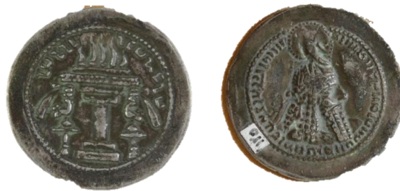
تصویر ۱: سکه اردشیر اول (شماره اموالی ۷۲۶۶، آرشیو عکس سکه‌های ساسانی موزه کرمان)

شد که در مواردی ممکن بود یک پادشاه چندین نمونه تاج داشته باشد که این خود می‌تواند نشأت گرفته از وقوع یک رخداد مهم تاریخی-سیاسی چون شکست یا پیروزی بر دشمن در زمان حکومت آن پادشاه باشد (گوبل، ۱۳۸۳: ۴۳۱ - ۴۳۲؛ سرفراز و آورزمانی، ۱۳۷۹: ۸۷ - ۹۳). پس در واقع می‌توان گفت پادشاهان ساسانی هرگاه شکست سختی را متحمل می‌شدند و یا اورنگ شاهی آنان غصب می‌شد نشانه این اتفاقات، به صورت تغییراتی فاحش در ظاهر تاج آنان نمود پیدا می‌کرد و چنانچه این شکست جبران و اورنگ پس گرفته می‌شد تزئیناتی بر تاج شاهی افزوده می‌شد (Gnoli, 1991: 115-118; Gnoli, 1999: 315).