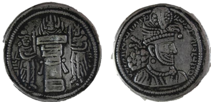
تصویر ۷: سکه هرمز دوم (موزه کرمان، آرشیو مجموعه سکه‌های ساسانی، شماره اموالی ۳۱۹۱)

معنی نیرومند است. شاید شاهان ساسانی به دلیل همین صفت اهورایی‌اش بوده که پیوسته به این ایزدبانو توسل می‌کردند و از او یاری می‌خواستند و مراسم تاج‌گذاری خود را در معابد این ایزدبانو اجرا می‌کردند (هینلز، ۱۳۹۱: ۳۸-۴۱). در تفسیر ظهور عقاب بر تاج شاهی هرمز دوم می‌توان گفت که هرمز دوم سعی داشته انتخاب خود به عنوان پادشاه و فرمانروا را به ایزدبانو آناهیتا نسبت دهد و از این طریق نشان دهد که تحت حمایت این ایزدبانو بوده‌است و چونان پدرش نرسی نشان دهد که سرپرستی و تولیت معبد آناهیتا از آن اوست. در ادبیات فارسی هما یا شاهین به عنوان مظهر سعادت‌بخشی و فره حضور دارد. اگر هما را همان مرغ وارغن بدانیم، باید پیشینه هما را در اوستا و در مرغ وارغن جستجو کنیم. در اوستا ذکر شده که پر مرغ وارغن به دارنده آن بزرگی و فره می‌بخشد. قدامت معتقد بوده‌اند که همای هرگاه بر سر کسی نشیند او را به پادشاهی و سعادت می‌رساند یا برای رسیدن به پادشاهی کافی بود که سایه همای بر سر کسی بیفتد.