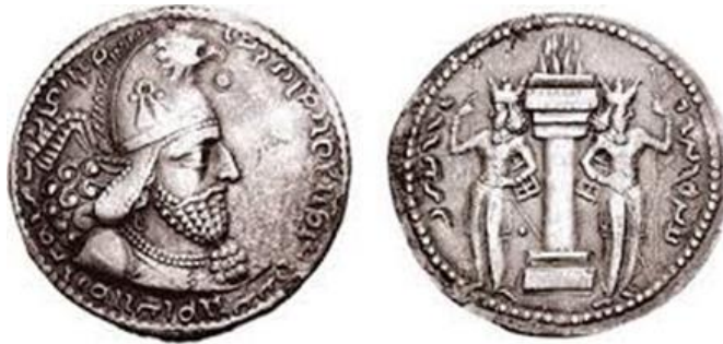
تصویر ۲: سکه شاپور اول با تاجی که نقش عقابی بر روی آن نمایان است.

از یکدیگر هستیم (دادور و مکوندی، ۱۳۹۱: ۲۸). بر اساس تقسیم‌بندی گوبل تاج شاپور اول به چهارگونه فرعی تقسیم می‌شود (جدول ۱). در گونه چهارم شاه تاجی بر سر دارد که شبیه کلاهی است که در بالای آن سر عقابی نمایان است و مرواریدی در منقار دارد، پیدایش این نشانه بر تاج شاهی شاپور اول می‌تواند نشانه‌ای از ایزدبانو آناهیتا باشد؛ شاید شاپور هنگامی که در جایگاه مقام ارشد روحانی و سرپرست نیایشگاه آناهیتا ایفای نقش می‌کرد این تاج را بر سر می‌گذاشت (تصویر ۲) و این احتمالاً متقارن با اوایل سلطنت شاپور اول بوده است چرا که وی در نقش برجسته جنگی فیروزآباد (تصویر ۳) هم با همین تاج ظاهر شده و این نقش برجسته مربوط به اوایل حکومت شاپور است (آرام، ۱۳۹۲: ۲۷).