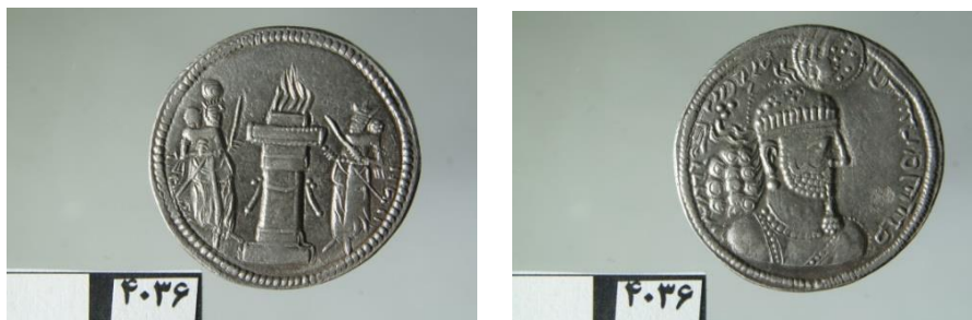
تصویر ۸: سکه نرسی با تاجی کنگره‌دار (موزه همدان، آرشیو سکه‌های ساسانی، سکه شماره ۴۰۳۶)

در اینجا باید به یقین اذعان داشت که در دوران کرتیر شاهان ساسانی به میزان زیادی قدرت خود را در جایگاه تولیت و نگهبانی معبد آناهیتای استخر به نفع کرتیر از دست دادند و این اوضاع تا زمان نرسی ادامه داشت و این نرسی بود که دوباره این جایگاه را به شاه ساسانی بازگرداند. بی‌شک کرتیر با حمایت از بهرام اول و بهرام دوم در مقام ولایتعهدی و جانشینی پادشاه در به سلطنت رسیدن آنان نقش داشت و در قبال آن به مقام نگهبانی از معبد آناهیتای استخر دست یافت. با به سلطنت رسیدن نرسی و کنار گذاشتن کرتیر از سوی او تغییرات عمده‌ای در شاهنشاهی ساسانی پیش آمد که بازتاب و نمود این تغییرات در تزئینات تاج شاهی و به تبع آن بر رو و پشت سکه‌هایی که از سوی نرسی ضرب شدند نمایان شد؛ از آن جمله در پشت برخی از