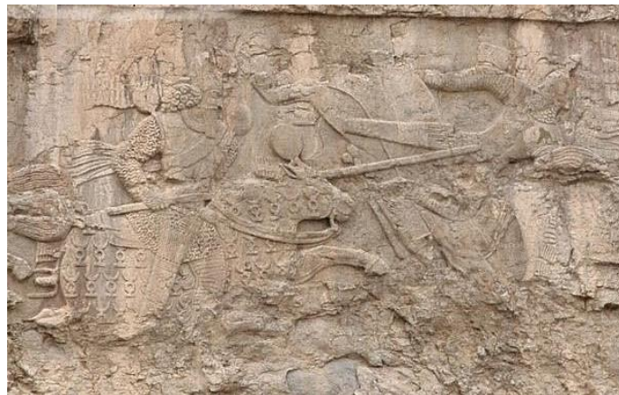
تصویر ۳: نقش برجسته جنگی فیروزآباد و تصویر شاپور اول نیزه به دست سمت چپ

( https://en.m.wikipedia.org/wiki/File:Coin_of_Shapur_I_with_eagle-headed_crown.jpg )