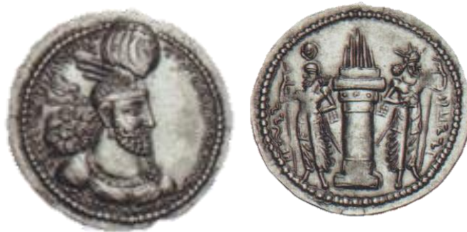
تصویر ۴: سکه بهرام دوم (Rezakhani, 2011: 347)

بهرام دوم سکه‌های متنوعی با طرح‌های گوناگون دارد. در اغلب این سکه‌ها بهرام با تاجی که بر روی آن بال‌های عقابی نمایان است ظاهر می‌شود (لوکونین، ۱۳۸۴: ۱۷۳-۱۷۴). تاج بالدار بهرام دوم در واقع نشانه‌ای از ایزد بهرام است؛ شاید بهرام دوم با آوردن این نشانه بر تاج خویش مدعی بوده که ایزد بهرام شهریار را به وی بخشیده و حافظ پادشاهی اوست (تصویر ۴).