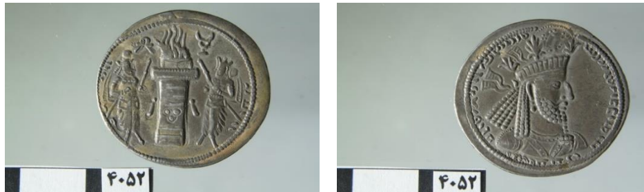
تصویر ۹: نرسی با تاجی که چند شاخه نخل بر آن نصب شده‌است (موزه همدان، آرشیو سکه‌های ساسانی، سکه شماره ۴۰۵۲)