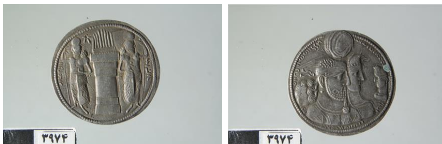
تصویر ۶: سکه خانوادگی بهرام دوم (موزه همدان، آرشیو سکه‌های ساسانی، شماره اموالی ۳۹۷۴)

بهرام دوم نخستین پادشاه ساسانی است که تصویر ملکه‌اش را در کنار خود روی سکه‌هایش ضرب کرد (امینی، ۱۳۸۹: ۱۲۳). در سکه‌های خانوادگی و گروهی بهرام دوم، تصویر همسر وی شاپوردختک گاه با تاجی به شکل اسب، سگ و قوچ دشتی و گاه به شکل پرنده‌ای که بی شباهت به عقاب نیست دیده می‌شود و روبروی آنها، در سمت راست تصویر، نیم‌تنه‌ای دیده می‌شود که در تعدادی از سکه‌ها، این نیم‌تنه تاج عقاب مانندی چون تاج ملکه بر سر و حلقه‌ای در دست دارد (تصویر ۵) و در تعدادی دیگر از سکه‌ها این نیم‌تنه بدون تاج است و حلقه‌ای در دست ندارد (تصویر ۶) و به جای تاج، کلاهی مادی بر سر دارد (گاریبلی، ۱۳۹۵: ۱۳-۱۴).