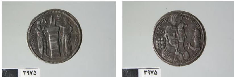
تصویر ۵: سکه خانوادگی بهرام دوم (موزه همدان، آرشیو سکه‌های ساسانی، شماره اموالی ۳۹۷۵)

در اساطیر ایران باستان ایزد بهرام توانایی آن را دارد که به ده تجسم گوناگون درآید؛ هفتمین تجسم از تجسم‌های این ایزد، پرنده‌ای است که اسطوره‌شناسان آن را عقاب یا شاهین می‌دانند (گاریبلی، ۱۳۹۵: ۱۲-۱۳). در اینجا باید یادآوری کرد که در فرهنگ ایران باستان پرنندگان منادیان نیک‌اقبالی و بخت بلند بوده‌اند و در اوستا فره ایزدی بارها به پیکر مرغ وارغن در می‌آید ( اوستا کهن‌ترین سرودهای ایران، ۱۳۷۱: ۴۹۰-۴۹۱ ).