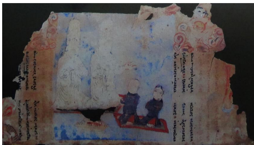
IB4974 (کلیم کایت، ۱۳۸۴: ۱۶۲)

گاه نیایش‌های جمعی با حضور تعداد اندکی برپا می‌شد. به‌عنوان نمونه در برگه مصور از یک کتاب مانوی که به مراسم توبه ۱۲ معروف است (IB4974)، شاهد برگزاری مراسم نیایشی با تعدادی از مانویان در کنار بزرگان هستیم که با موسیقی و نواختن ساز زهی همراه بوده است. (همان: ۱۲۱)