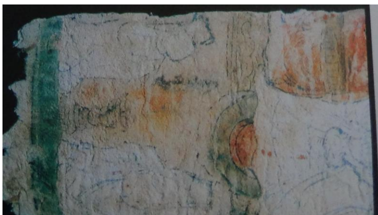
THH 260 (کلیم کایت، ۱۳۸۴: ۱۵۹)

متنی نیایشی به زبان ترکی میانه به خط مانوی در مدح مانی آمده است. (کلیم کایت، ۱۳۸۴: ۱۲۲)