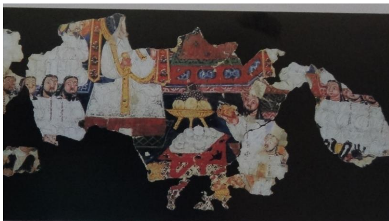
IB 4979 (کلیم کایت، ۱۳۸۴: ۱۵۵)

نیایش‌های جمعی گاه با حضور جمع زیادی از مانویان و گاه با تعداد اندکی از مانویان برگزار می‌شد. در بخش بزرگی از یک برگ نقاشی مربوط به مراسم بما (IB4979) ۱۱ تصویر مراسمی نیایشی را شاهد هستیم که به‌صورت جمعی به‌جای آورده شده است. در این مراسم نیایشی، مانویان بر اساس نقش و طبقه‌ای که به آن تعلق دارند در جایگاه خود قرار گرفته و مراسم نیایش با این تشریفات برگزار می‌شود. (کلیم کایت، ۱۳۸۴: ۱۰۹)